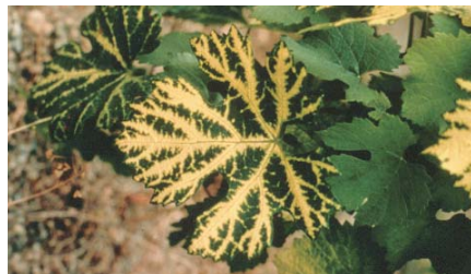
Figura 2: La formación de bandas amarillas en las nervaduras de las hojas puede variar. Los síntomas en las hojas con la enfermedad de amarilleo de las nervaduras varían pero son más drásticas en climas fríos. Los síntomas foliares incluyen: distorsión, moteado y tamaño reducido de la hoja. Los síntomas típicos de la enfermedad de las venas amarillas se encuentran en las infecciones del virus "Tomato ring spot virus" en California

Como lo mencionáramos anteriormente, el principal método de transmisión de virus de la vid es por traslado y propagación de vides infectadas. La transmisión del virus ocurre por injertación de material de poda enfermo sobre portainjertos sanos y viceversa o la propagación de estacas infectadas. Es conocido que los nemátodos son transmisores de ciertos virus que infectan a las vides, particularmente aquellos que causan las enfermedades de decaimiento de la vid y hoja en abanico o "fanleaf". Los nemátodos infectados pueden ser diseminados desde las raíces de las plantas, a través del suelo, agua y por las tareas culturales de rutina del viñedo. Además, se sabe que muchos de estos virus que causan las enfermedades de decaimiento de la vid infectan también a las malezas presentes en el viñedo. Por lo que el control de plagas debería ser una tarea de rutina usada para mantener un viñedo saludable.